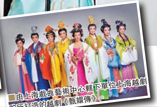
■ 由上海戲曲藝術中心轄下單位上海越劇院所打造的越劇《甄娘傳》。