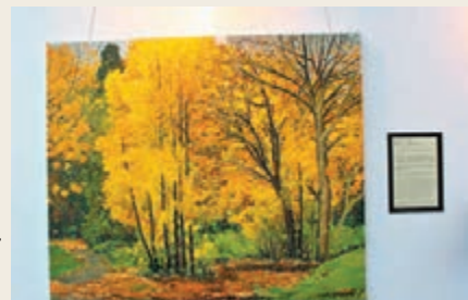
■ 現場亦展出高楠的油畫作品。